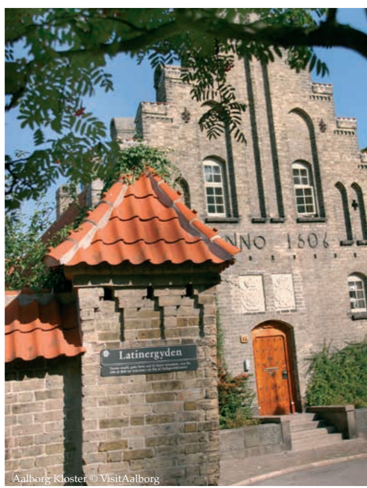
Aalborg Kloster

Langbrovase - den gamle dæmningsvej. [51] Tidligere var området her meget sumpet og derfor svært fremkommeligt. For at sikre de vejfarende blev "vasen" anlagt - det er navnet for et vadested eller vejforløb bygget af ris knipper, grene og sten. Først op i 1900-tallet blev vejen brolagt.