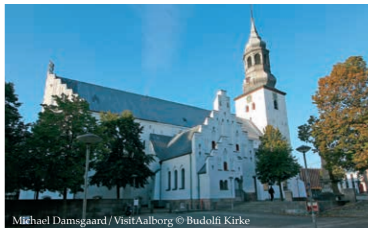
Mikhael Damsgaard / VisitAalborg © Budolfi Kirke

Hammer Bakker. [60A] De skovklædte og naturrige bakker afbrudt af nedskårne kløfter hæver sig som en ø i landskabet. Den stenede og sandede bund lever kun plads til få vådområder - det største er Pebermosen [60B] , hvor der blandt andet vokser den insektædende soldug. Bakkerne har været trafikalt knudepunkt med mange bevarede halvvejsspor, og frem til 1688 holdt Kjær Herred ting [60C] i bakkerne.