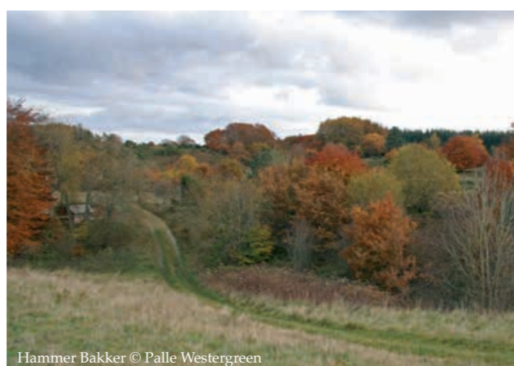
Hammer Bakker

Ørum Kirkes døbefont. [47] Den senromanske Ørum Kirke gemmer på en stor romansk granit-døbefont med en helt særlig historie. Sammen med slirigt udhuggede buegange og billedfriser har stenmesteren som noget ganske særligt sat sin signatur med en runeinskription: "Nikolaus gjorde mig".