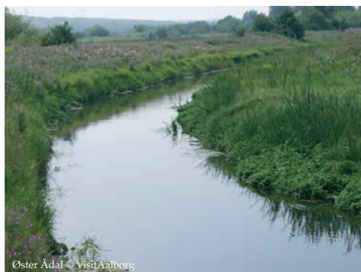
Øster Ådal

Sorthøj - en arkæologisk oase. [53] Højdedraget har tiltrukket mennesker i både stenalder, bronzealder og jernalder. To bronzealderhøje kroner bakkedraget, og under grønsværen ligger rige bebyggelsespor fra slutningen af bondestenalderen og en større landsby fra germansk jernalder. Herudover har 4.000 år gamle flintminer skåret dybe huller ned i kalkbunden.