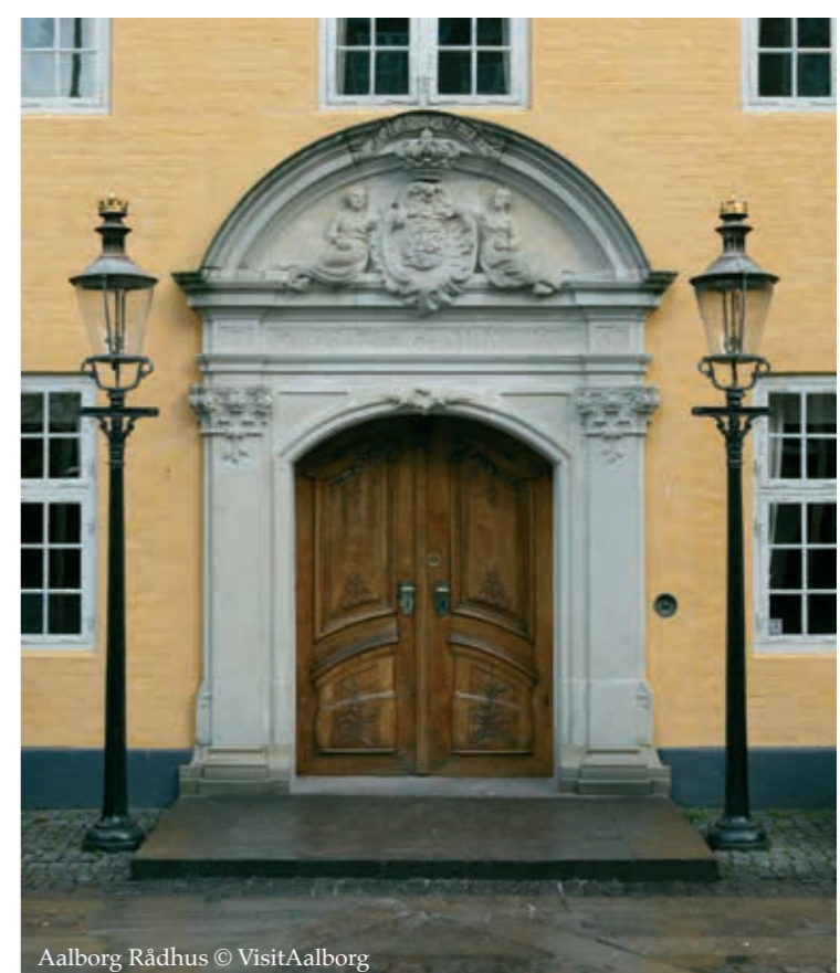
Aalborg Rådhus

Øster Ådal and Skipper Clement. Like a green wedge, Østerådal [64A] with its many fine nature experiences, pushes itself far into the city [64B] . During the Danish civil war, "Grevens Fejde" (The Count's Feud) from 1534 to 36, the idyllic river valley became a setting for a bloody battle. Skipper Clement's army of peasants lured the heavily armed horsemen of the Count's army out into the pond where they got stuck and easily fell victim to the peasants' scythes and pickaxes of the peasants. However, a few months later Clement's army was attacked during a bloody storm on Aalborg, bringing the great Danish Peasants' Revolt to an end.