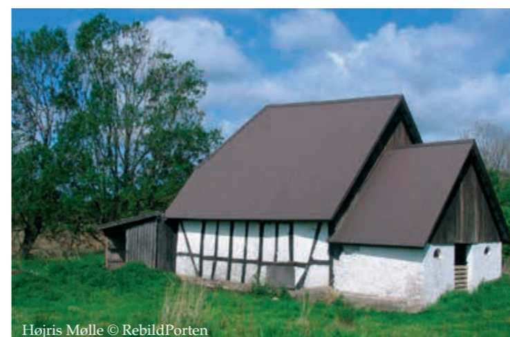
Højris Mølle

Hjeds Kær - en rigtig blomstereng. 57 Fra Veggerby kirkegård får du et godt kig ud over det store kærområde, og det er nemt at forestille sig, at her tidligere har ligget søer. En mosaik af dyrkede arealer, enge, søer og pilekrat danner i dag ramme om en blomsterrigdom med blandt andet fire orkidearter og farverige blomster som trevlekroner og engblomme.