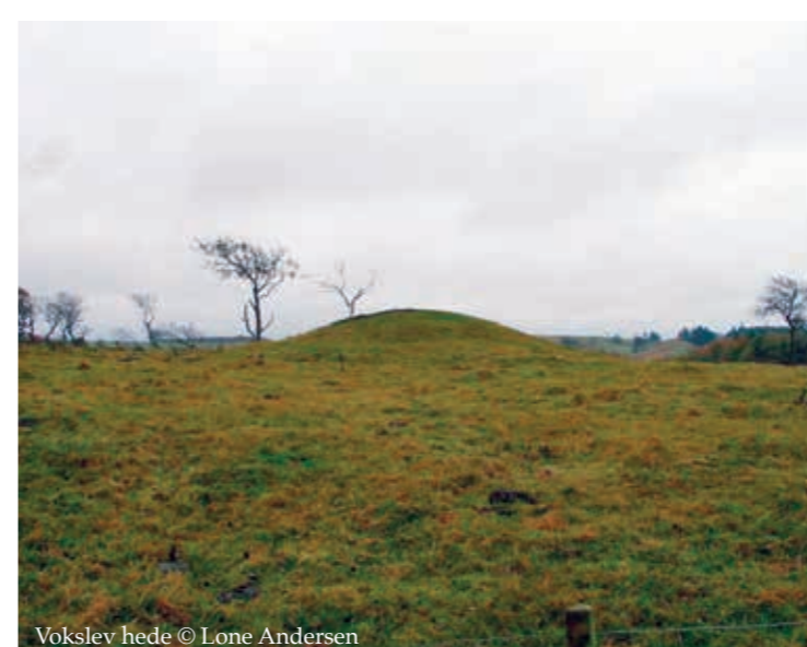
Vokslev hede

Frendrup Nihoje - på landskabets top. 55 En af Himmerlands mest markante højgrupper og med en imponerende udsigt. På trods af navnet er der dog kun bevaret 7 høje, der ligger som perler på en snor. Højene er fra bronzealderen ligesom skåltegnstenen ved lågen ind til området. Skåltegn er symboler for sol og frugtbarhed. Hvis de er svære at se, så mærk med fingerspidserne.